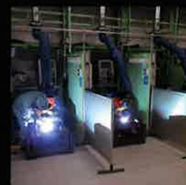
溶接を徹底的に練習