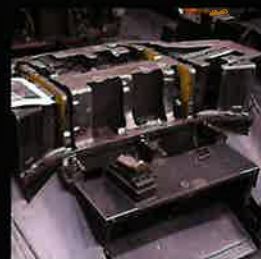
本型を使った実技