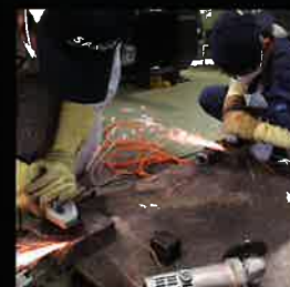
仕上げ作業の練習