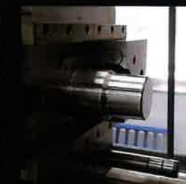
コップの成形トライ