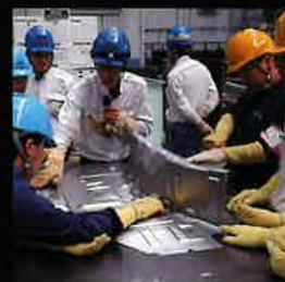
トライ品の不具合洗い出し