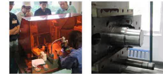
精密肉盛り練習 コップの成形トライ