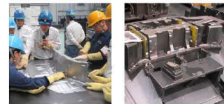
トライ品の不具合洗い出し 本型を使った実技