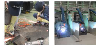
仕上げ作業の練習 溶接を徹底的に練習